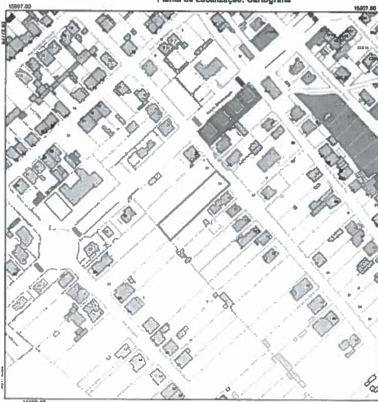
Planta de Localização: Cartografia

Foi condicionante do licenciamento de construção de uma habitação unifamiliar com Processo nº ED/2023/257, a cedência gratuita para o domínio público, de uma parcela de terreno com a área de 62.40m 2 , do prédio inscrito na Matriz nº 7805, natureza urbana e descrito na Conservatória do Registo predial de Castelo Branco sob o nº 3598/19941207, freguesia de Castelo Branco.